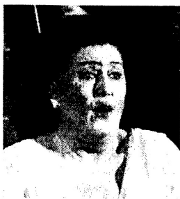
Анна Томова-Синтова в "Сватбата на Фигаро"